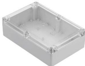
Obudowa hermetyczna ZP210.140.60