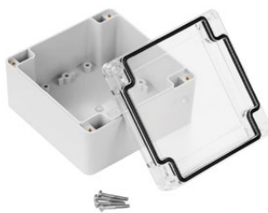
Obudowa hermetyczna ZP105.105.60S z uszczelką zalewaną